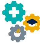
Agences de développement